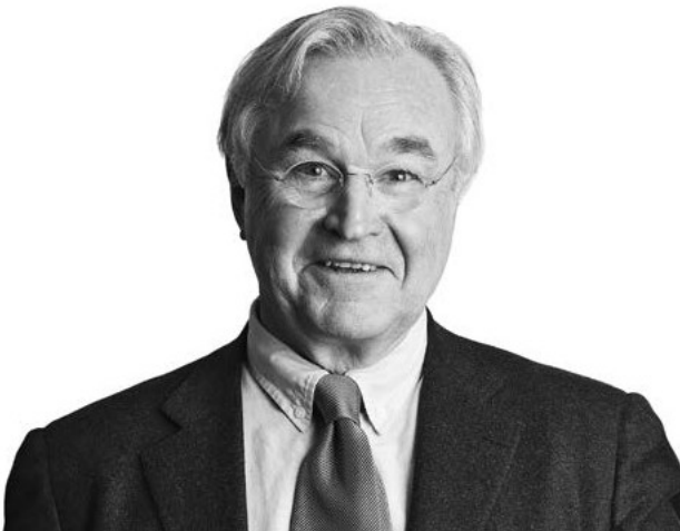
Styrelseordförande Sven Hagströmer