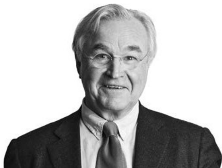
Styrelseordförande Sven Hagströmer